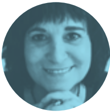
ROSA MONTERO 26 DE OCTUBRE | 19.00H