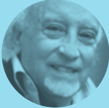
MANUEL VICENT 28 DE OCTUBRE | 20.15H